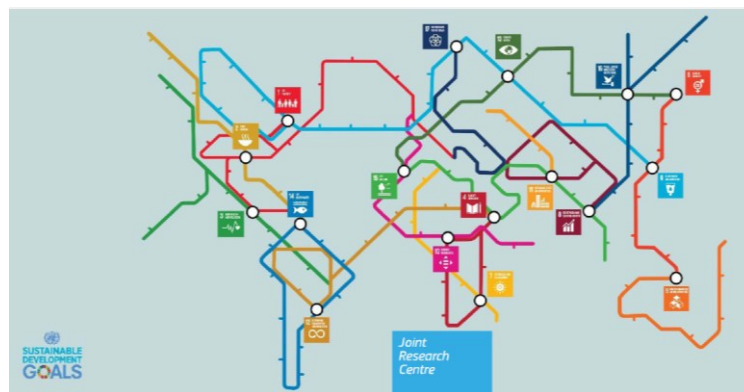
Figura 1: Interligação dos ODS 21

fundamentais, económica, social e ambiental frequentemente abordadas de forma fragmentada (ONU, 2016). Esta abordagem integrada possui dupla relevância. Primeiramente, quanto à integração tridimensional, parte-se do pressuposto de que a concretização dos objetivos só é possível mediante a consideração equilibrada destas dimensões. Todas as ações, sejam nacionais, regionais ou institucionais, de carácter público ou privado, devem incorporar este compromisso (ONU, 2015). Em segundo lugar, no que diz respeito às interligações entre os Objetivos de Desenvolvimento Sustentável (ODS) da Agenda 2030, essas conexões buscam: assegurar maior ênfase nas sinergias entre os objetivos, reforçar os compromissos mútuos e ampliar a possibilidade de medição de metas e indicadores de causa e efeito (Instituto Nacional de Estatística [INE], 2015. Essa abordagem evidencia claramente que os ODS são indivisíveis e interdependentes. Uma ação pode impactar direta ou indiretamente no cumprimento de outros objetivos, seja positiva ou negativamente. A compreensão dessas nuances é fundamental para sua efetiva implementação (União Europeia, 2023).