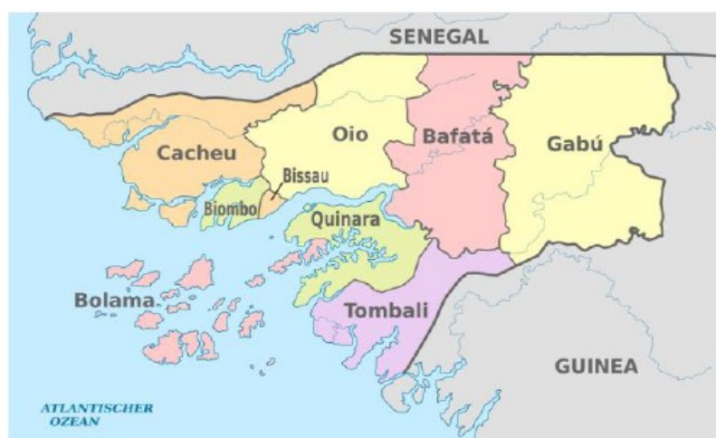
Figura 5: Mapa da divisão administrativa da Guiné-Bissau.

Administrativamente, a Guiné-Bissau organiza-se em três províncias (Norte, Sul e Leste), oito regiões (Bafatá, Biombo, Bolama-Bijagós, Cacheu, Gabú, Oio, Quinara e Tombali) e 1 Setor Autónomo (Bissau). As regiões e o Setor Autónomo subdividem-se, no conjunto, em 39 sectores, que por sua vez se dividem em secções e tabancas ( aldeias ), (INE, 2009).