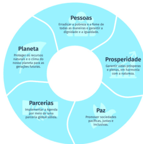
Figura 2: Os 5P de ODS-Objetivos de Desenvolvimento Sustentável 23