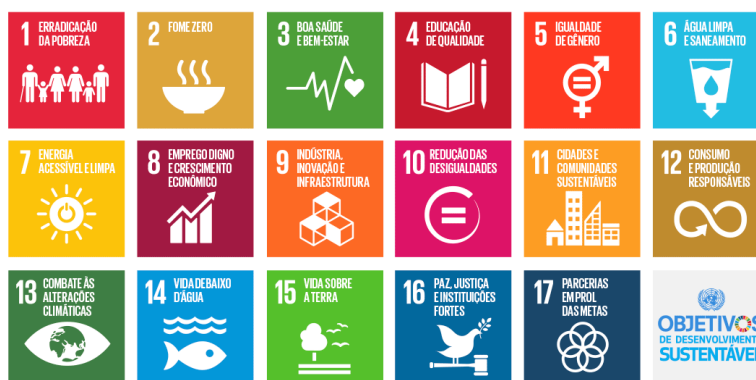
Figura 6: Os 17 Objetivos de desenvolvimento sustentável 114