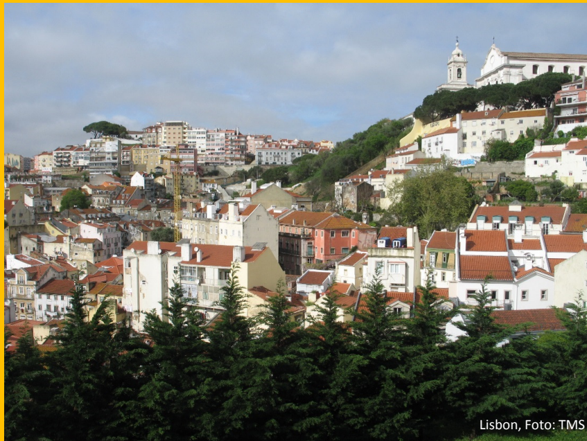
Lisbon, Foto: TMS

Guest professors from both universities will present topics that will inspire students to develop their projects in the group work. Architects, other professionals of the Lisbon City Council and local agents will also share their experiences.