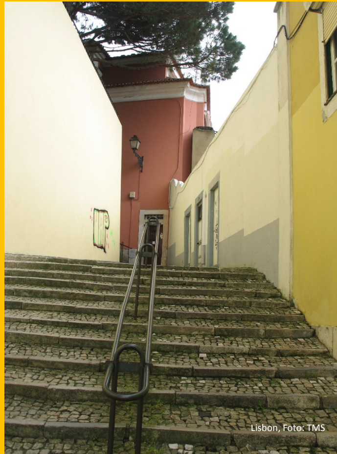
Lisbon, Foto: TMS