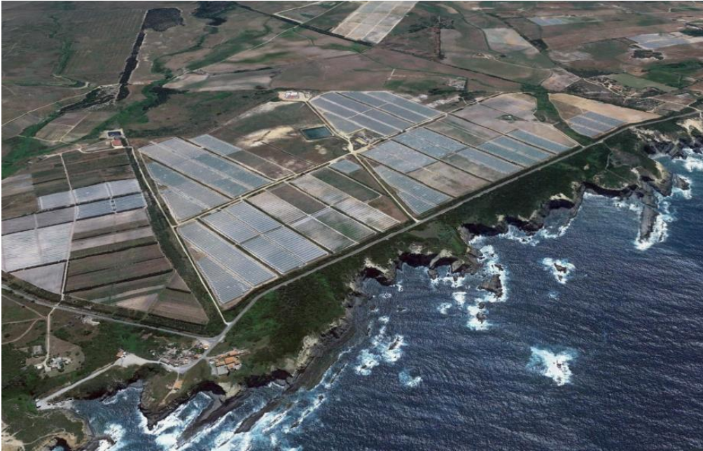
Figura II.3: Estufas destinadas à produção hortícola na Zambujeira do Mar