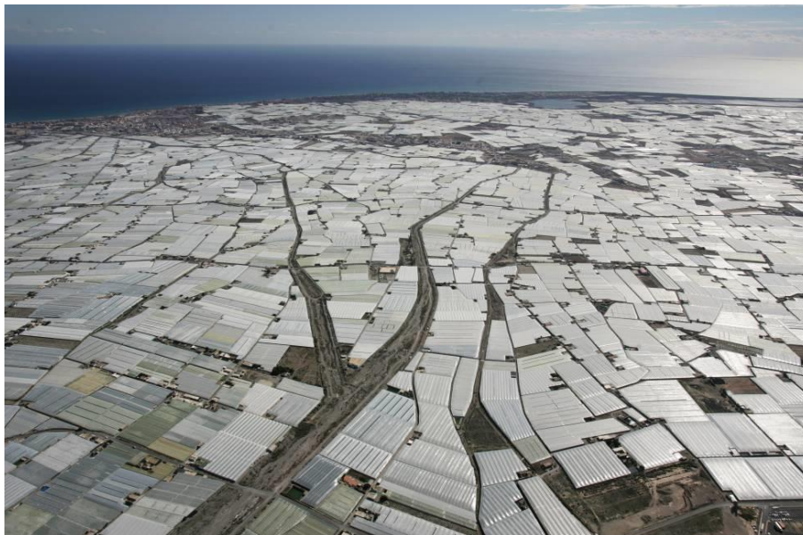
Figura II.1 Vista aérea das estufas de El Ejido (Almería)

Numa última e atual fase, Almería, enfrenta uma forte contestação desde social, política, económica e sobretudo ambiental relativa à sua sustentabilidade.