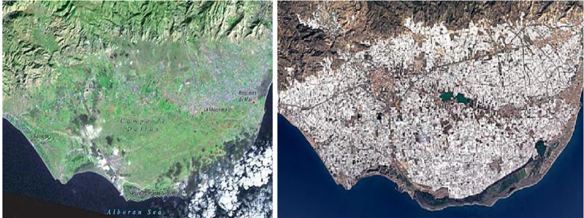
Figura II.2: Comparação da imagem de satélite da região de Almería em 1974 e 2014