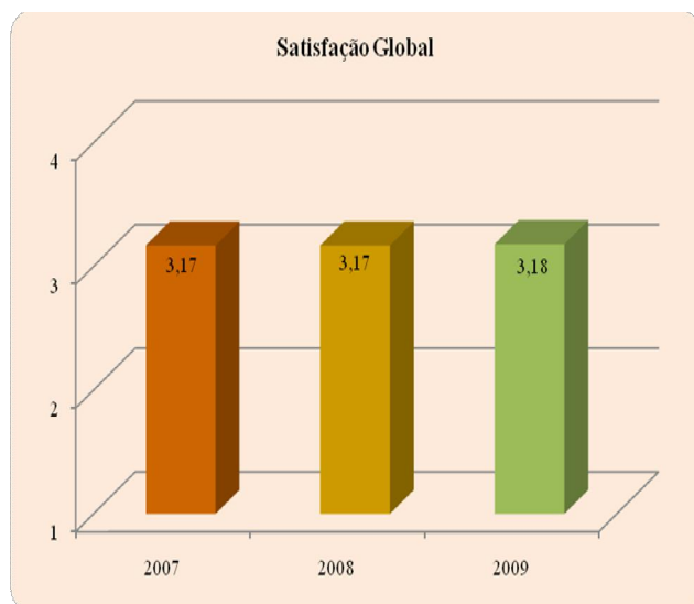
Gráfico 1: Níveis de Satisfação Global dos Utilizadores da Biblioteca do ISCTE-IUL (2007, 2008 e 2009; média)

Relativamente aos níveis de satisfação global, estes têm-se mantido praticamente inalteráveis ao longo dos três anos, conforme se pode verificar no Gráfico 1, sempre acima do 3 numa escala de satisfação de 1 a 4.